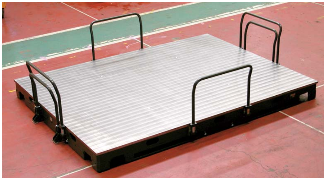
(移動用ハンドル、ブレーキ用ハンドル取付状態)