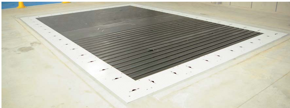
テクニカルセンター 試験定盤 トヨタ自動車九州(株)様 (福岡県 宮若市)